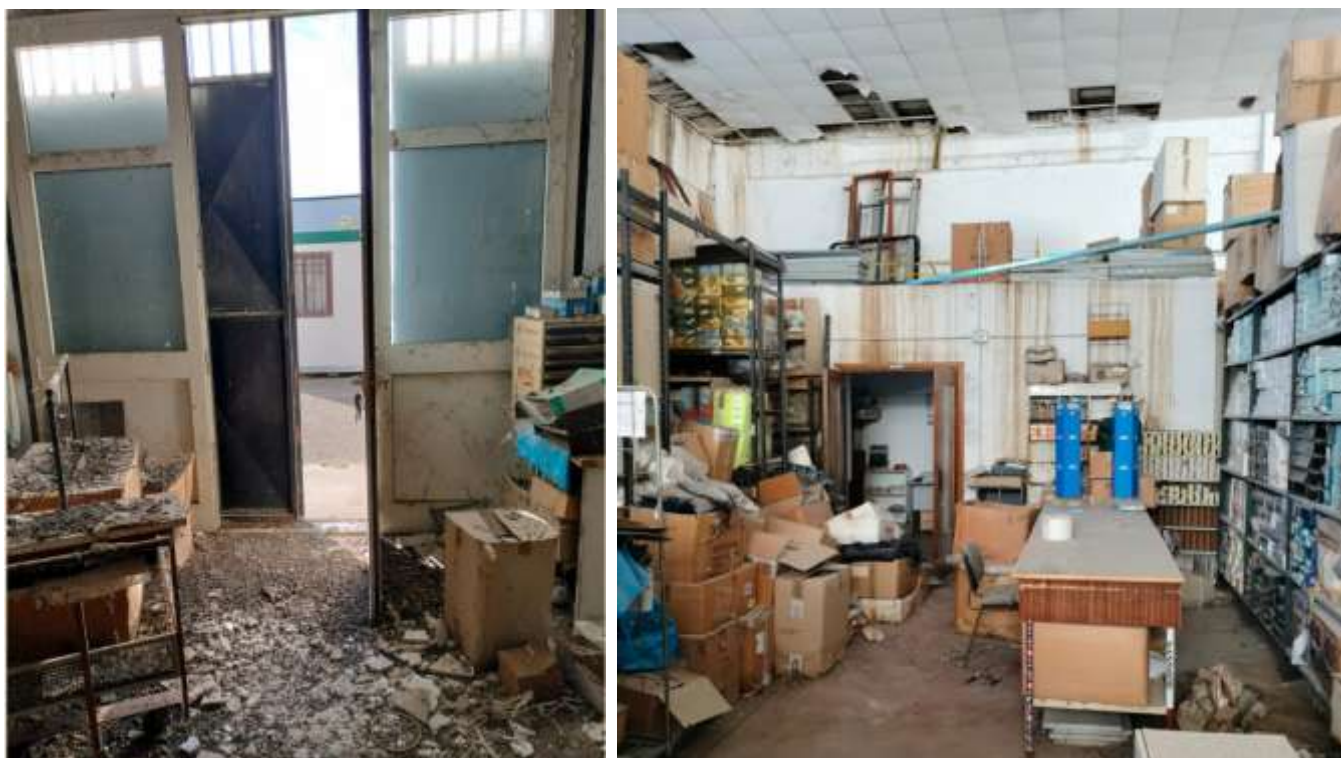
Sub 4 (magazzino fronte strada)